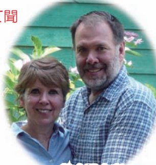
教会設立者の シェーファー師夫妻

教会をはじめて訪れる理由はさまざまですが、川口キリスト教会では、皆さんを暖かくお迎えします。